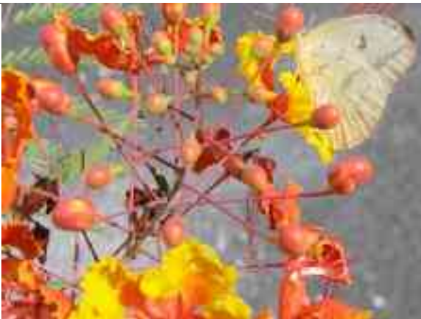
આંગણે ઊગેલાં ગુલમહોર!