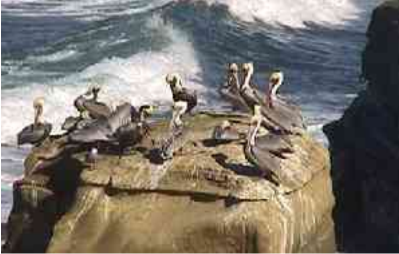
શિયાળુ તડકો, લાહોયાને ઓટલે!